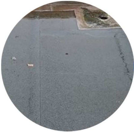
Renflement / Obstacle faisant obstacle à l'écoulement