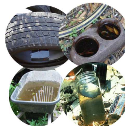
Objets divers abandonnés