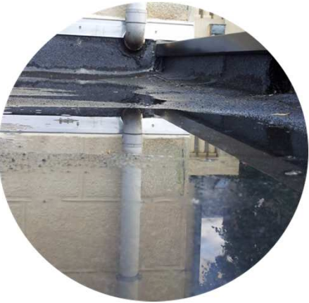
Mauvaises pentes Défauts de planéité