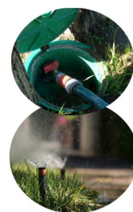
Entretien d'espaces verts