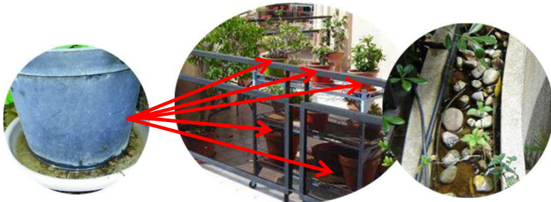
Sous-pots / Soucoupes / Vases / Coupelles / Balconnières

➔ supprimer toutes les eaux résiduelles, de début mars à fin octobre .