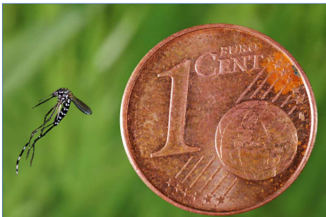
Aedes albopictus (ou « moustique tigre »)