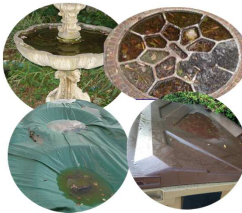
Bassins / Bâches / Plaques / Poubelles...