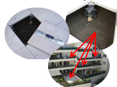
Terrasses sur plots