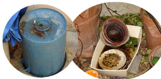
Récipients divers soumis aux pluies