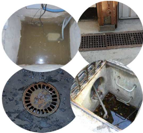
Réseau pluvial extérieur / Puisards / Regards