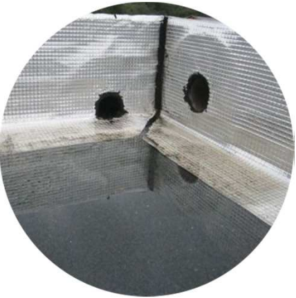
Évacuations mal positionnées